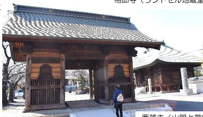
西蓮寺（山門と薬師堂）