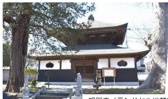
相即寺（ランドセル地蔵堂）