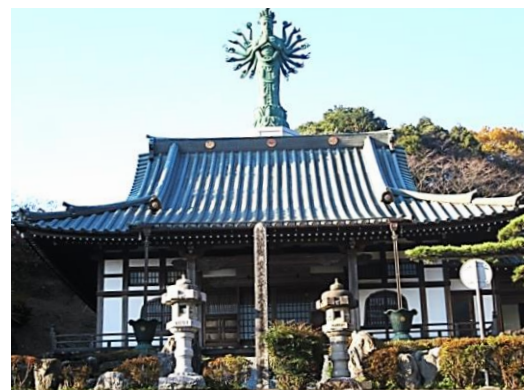
東光寺 (町田市小野路)

この七福神の信仰は、室町時代の末期のころから、当時の庶民性に合致して民間信仰の形となって広まってきました。「七難即滅、七福即生」の説に基づき、七福神を参拝すると七つの災難が除かれ、七つの幸福が授かると言われています。