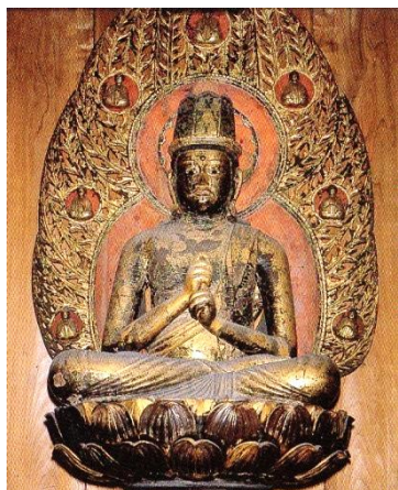
龍見寺大日如来像

高尾駅南口には「みころも霊堂」、「菅原道真」の大きい立像、全国から集めた各都道府県木の植え込み、などもあります。