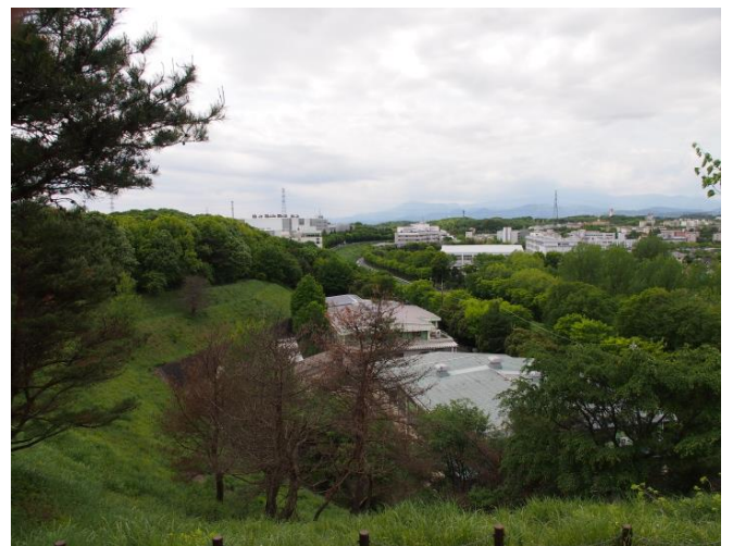
防人見返りの峠から