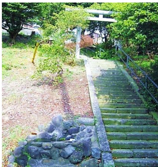
滝の沢不動(吾妻神社)